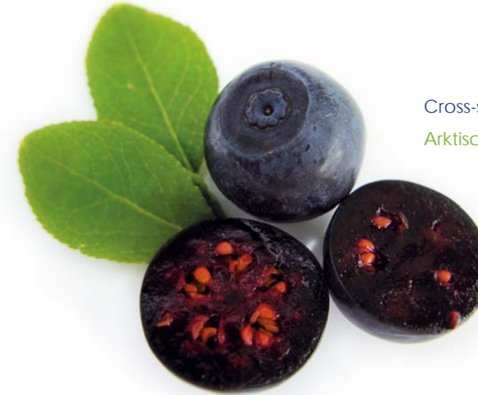
Cross-section of an Arctic bilberry

Mit einem Durchmesser von 6 bis 8 Millimetern ist die arktische Heidelbeere kleiner als die hochbuschige Kulturheidelbeere. Arktische Heidelbeeren wachsen einzeln an den Zweigen eines verästelten Strauches von 10 bis 40 Zentimetern. Die mit einer hauchdünnen Wachsschicht überzogene dunkelblaue Schale der arktischen Heidelbeere ist weich und bricht leicht.