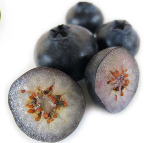
Cross-section of a cultivated blueberry