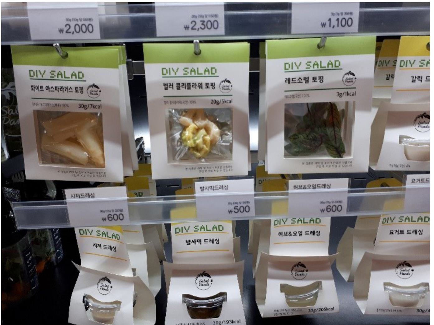
Salaattitarpeissa oli tarjolla jopa todellisia miniatyyripakkauksia.