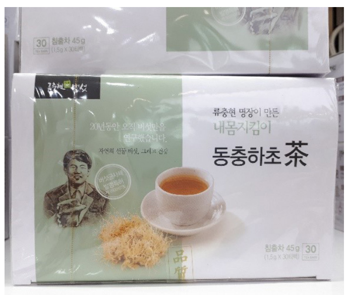
Sienjuomavalikoimaa lentokentällä. 45 g 9$, kilohinta siis 200 $/kg.