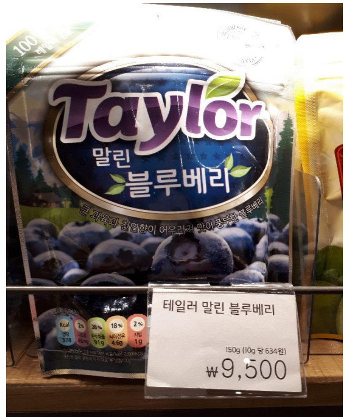
Marjoja löytyi kaupista niin pakasteina, kuivattuina kuin mehuinakin. Hinnossa oli melko suurta vaihtelua.