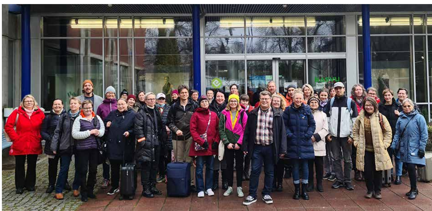
Luonnontuotealan kehittäminen vaatii aktiivista yhteistyötä ja tiedon jakamista. Kuvassa vuoden 2022 Luonnontuotepäivien osallistujia Mikkelissä.

Luomukeruutuotannon tilanne ei parantunut lainsäädännöllisten haasteiden ja korkeiden kustannusten vuoksi, huolimatta kolmivuotisen Luomua metsäluonnosta -tiedotushankkeen aktiivisesta toiminnasta.