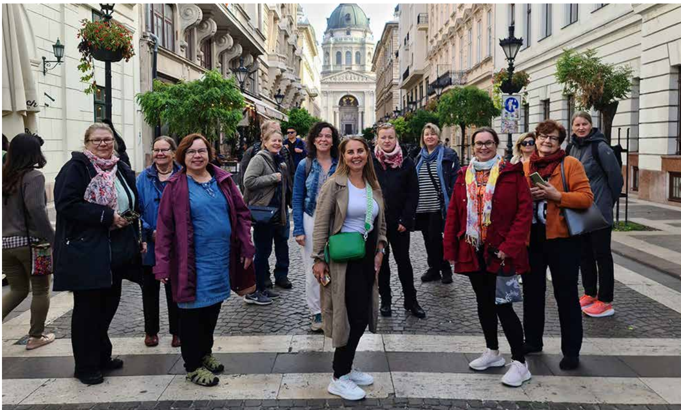
Unkarin matkalaiset ryhmäkuvassa.

Yhdistyksen sivuille täydennettiin tutkimustii- vistelmiä, ja kansainvälisen mediaa avustettiin vastaamalla sähköpostitse kyselyihin. Kansanvä- linen media käyttää sivustoa myös omatoimisesti lähteenään. Esimerkiksi eräs japanilainen julkai- su, jossa viitattiin Arktiset Aromit ry:n sivuille puolukan tiedon lähteenä, tavoitti yli 36 miljoonaa lukijaa.